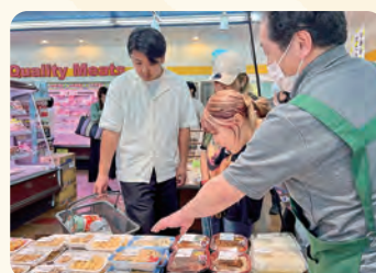
スーパーあさな。副店長より店内ご案内と特産品のご説明