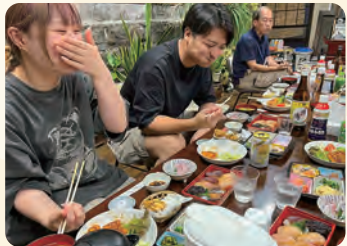
夕食。八丈島の郷土料理中心のお食事をお召し上がりください