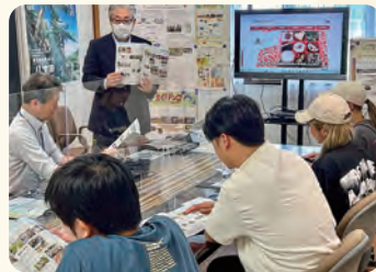
家政科・園芸科がある八丈高校の特色や島留学のご説明