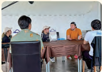
チーズ職人より八丈島移住とチーズ工房起業の体験談を聞く