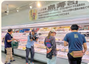
八丈ストアで昼食購入。島寿司は八丈島の郷土料理です