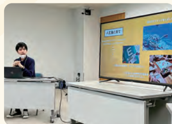
八丈島支店勤務の移住者より八丈島の暮らし方の話を聞く