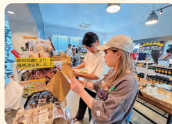
ローカルフード&リカー東京島酒専門山田屋を見学と買物