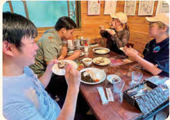
男めし食堂でランチタイム。人気の椎茸料理を堪能します