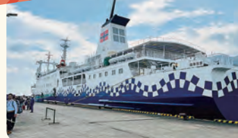
前夜10時半東京竹芝発の船に乗り、朝9時に底土港到着