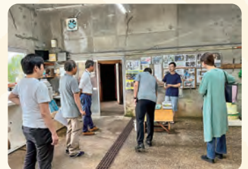
長田商店見学。八丈島特産くさや加工の特色と歴史などご説明