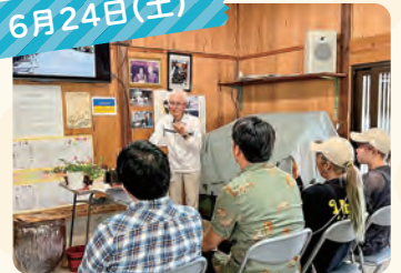
黄八丈めゆ工房。八丈島伝統工芸織物の歴史や特色などご説明