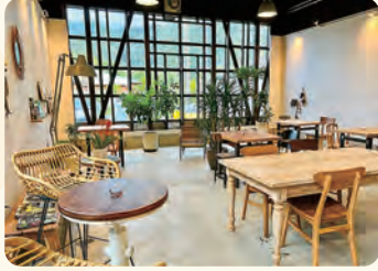
ボタニカルカフェDORACOで休憩後、玉石垣散策して宿泊先へ