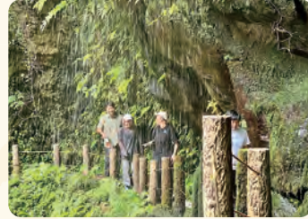
裏見ヶ滝散策。亜熱帯植物が茂る人気の観光スポットです