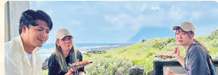
絶景スポット大淵浦園地の東小屋で海を眺めながら昼食