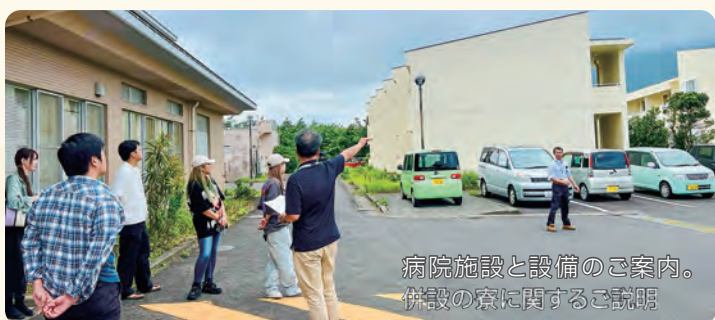
病院施設と設備のご案内。併設の寮に関するご説明