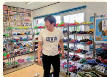
むかしのとみじろうで八丈島名物ギョサンや島Tシャツの買物