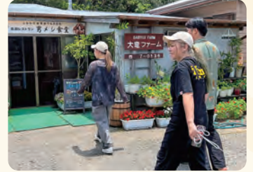
大竜ファーム男めし食堂で起業と八丈島移住のリアルを聞く