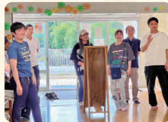
町立むつみ第二保育園。園長より園内ご案内とご説明