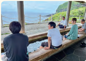
足湯さらめぎ。藍ヶ江の海を眺めながら移住者より体験談を聞く