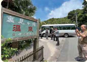
裏見ヶ滝温泉見学。八丈島には7つの町営温泉があります