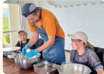
リードパークリゾートにてジャージーモzzarella作り体験