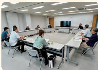
七島信用組合。支店長より行内ご案内と金融関係ご説明