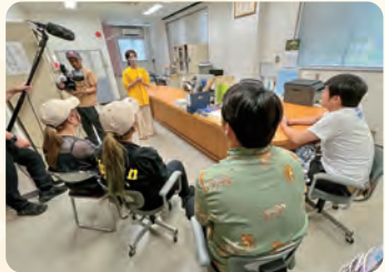
地域おこし協力隊で移住した黄八丈織り子さんの体験談を聞く