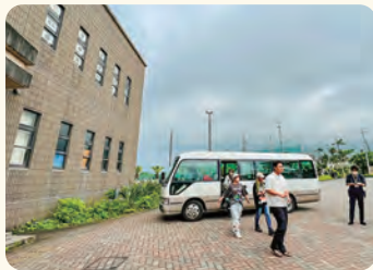
都立八丈高校到着。校長より校内をご案内いただきます