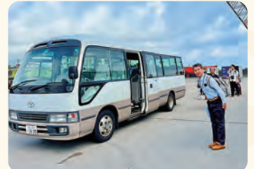
マイクロバスで、東武トップツアーと八丈島移住協がご案内