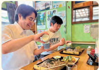
昼食。千両で八丈島特産明日葉天ざるをお召し上がりください