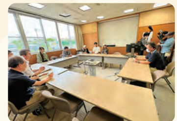
八丈町立病院。事務局長より島の病院事情のご説明