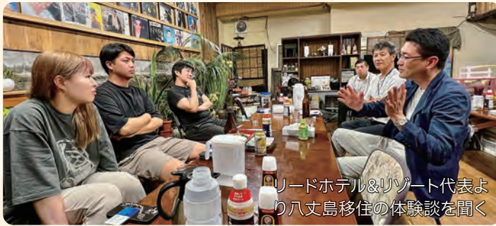
リードホテル&リゾート代表より八丈島移住の体験談を聞く