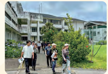
町立三根小学校。校長より校内ご案内とご説明