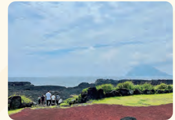
観光スポット南原千畳敷散策。溶岩畳の上を歩きます