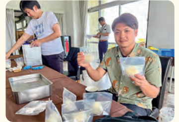
作ったモzzarellaはお土産にお持ち帰りいただけます