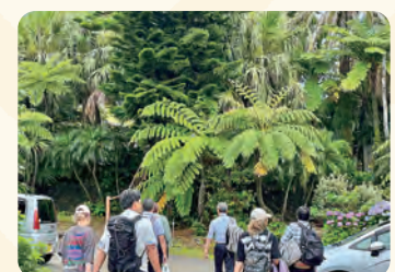
宿泊先のガーデン荘に到着。ヘゴシダに囲まれた南国の民宿