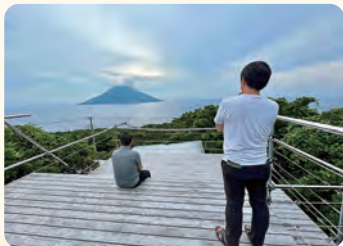
Island and office 見学。この後、八丈島空港へ向かいツアー終了